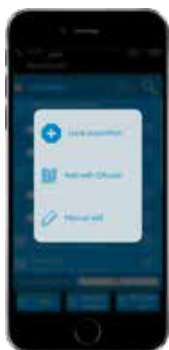
Gestion des radiocommandes