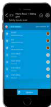
État des accessoires de sécurité