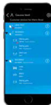
Gestion des clients