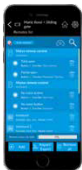
Gestion des sélecteurs